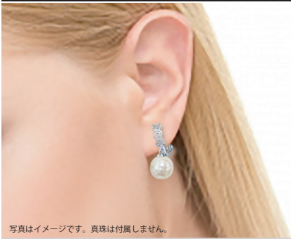
写真はイメージです。真珠は付属しません。